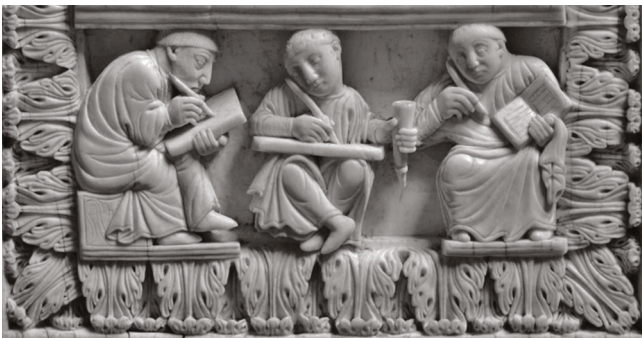
Mittelalterliche Schreiber, Elfenbein, Ende 10. Jh. (KHM-Museumsverband, Wien, Inv.-Nr. KK 8399)

Formulae , or templates for charters and letters, are signs of the diversity of early medieval scholarly writing in Western Europe prior to the 11 th century. Mostly passed on in collections, they testify to the linguistic shift that took place between late antiquity and medieval times and contain crucial information for social, economic and legal history as well as for the histories of culture and mentalities. Thus, the project, which is dedicated to the systematic examination of the formulae , the exploration of formulaic writing and their critical edition, annotation and translation, is set at the juncture between history, Latin philology and legal history. Next to its publication at the Monumenta Germaniae Historica the new edition will also be made available online. In addition, a publicly accessible database including an electronic lexicon will facilitate further studies into