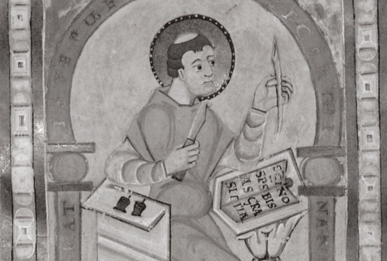
Notker der Stammler († 912), Dichter und Verfasser eines Formelbuches (Berlin, Staatsbibliothek zu Berlin, Ms. theol. lat. qu. 11, Fol. 144r [z. Zt. Krakau, Bibl. Jagiellonska], St. Gallen, 11. Jh.) Notker the Stammerer († 912), poet and author of a formulary (Berlin, Staatsbibliothek zu Berlin, Ms. theol. lat. qu. 11, fol. 144r [currently at Kraków, Jagiellonian Library], St. Gall, 11 th century)